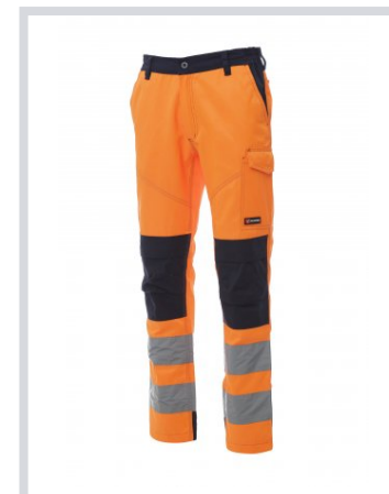
ARANCIONE FLUO/BLU NAVY