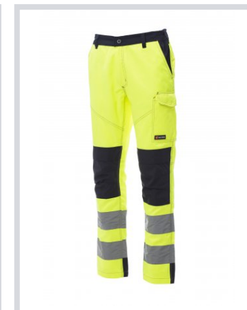
GIALLO FLUO/BLU NAVY